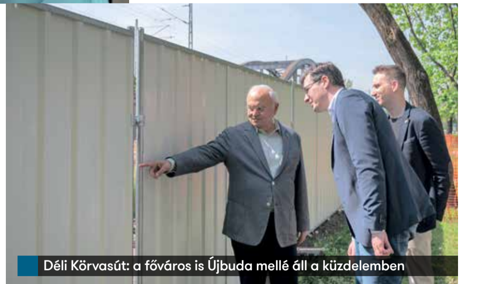
Déli Körvasút: a fővörös is Újbuda mellé áll a küzdelemben

Ezúton is őszinte részvétünk a családtagok felé a tragédia miatt. Azt egyelőre nem tudni, pontosan miért következett be ez a gázrobbanás, a tűzvizsgálat még tart. Az viszont már most elmondható, hogy a tűzoltóság, a katasztrófavédelem és a mentők példaértékű munkát végeztek. A tűzoltók összehangolt tevékenységének köszönhető, hogy nagyobb károk nem keletkeztek. Három olyan tűzoltót jutalomban és elismerésben részesítettünk, aki kiemelkedő tevékenységet végzett. Ha jól tudom, 11 tűzoltó dolgozott a mentésen, az egyikük meg is sérült. Amikor ott térdelek a bejáratnál, miközben lángokban állt a lakás, az egyik azt érezte, mintha valaki megveregette volna a vállát, de nem törődött vele. Amikor kijött az égő házból, a többiek szóltak, hogy csupa vér a háta. Kiderült, hogy egy üvegcsillánk zuhant le a magasból, ami átszűrva védőruhá-