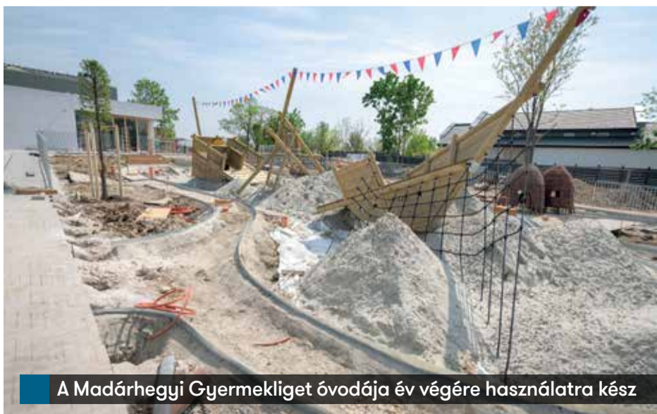
A Madárhegyi Gyermekliget óvodája év végére használatra kész

Még tart a nyomozás a Gazdagréti Szívárvány Óvoda egyik dolgozójának gyerekbántalmazási ügyében. Felmerült újabb információ az önkormányzat belső vizsgálata során?