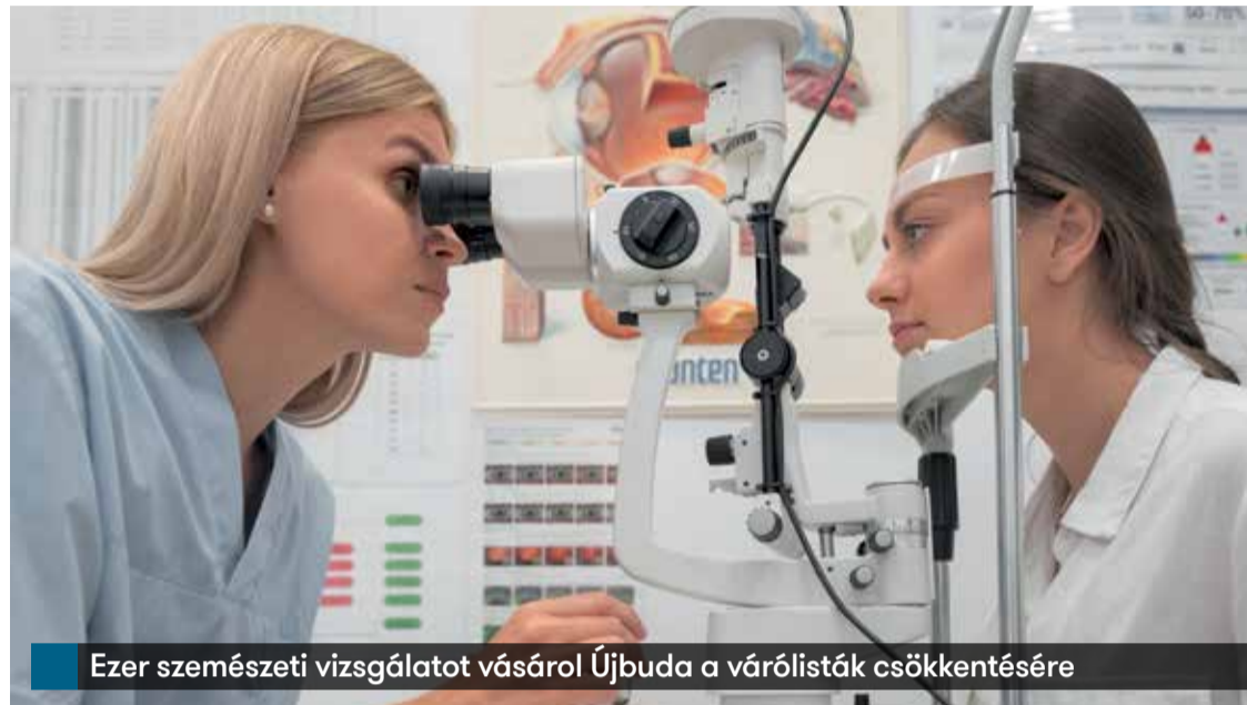
Ezer szemészeti vizsgálatot vásárol Újbuda a várólisták csökkentésére